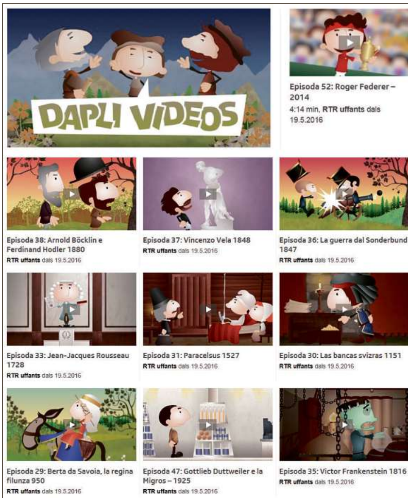
Ils films da Helveticus èn er cuntegnids en la purschida d'uffants da RTR.

39. Il Pilatus (1889) In spiert roman u in dragun starmentus? Nagin na sa propri danunder ch'el num da